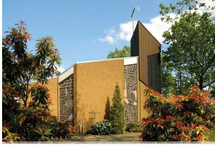
Christuskirche Sandbrinkerheidestraße 32 Brögbern

Sonntag, 18. Juni, 11.15 Uhr Gottesdienst mit Abendmahl zum Abschluss der Konfi 3-Zeit in Brögbern – Pastorin Mühlbacher