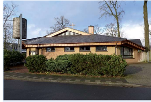
Kirchen- zentrum Lohne Friedensweg 3

Sonntag, 24. September, 17.00 Uhr Punkt 5-Gottesdienst – Pastor Meißner & Team, anschl. Getränk & Gespräch