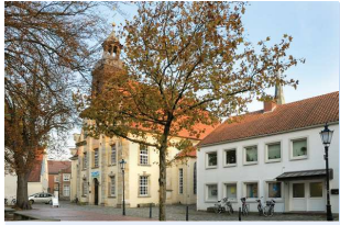
Kreuzkirche Universitäts- platz 1, Lingen

Sonntag, 18. Juni, 11.00 Uhr Gottesdienst mit Abendmahl für Klein & Groß zum Abschluss der Konfi 3-Zeit – Pastor Meißner, anschl. Kirchcafé