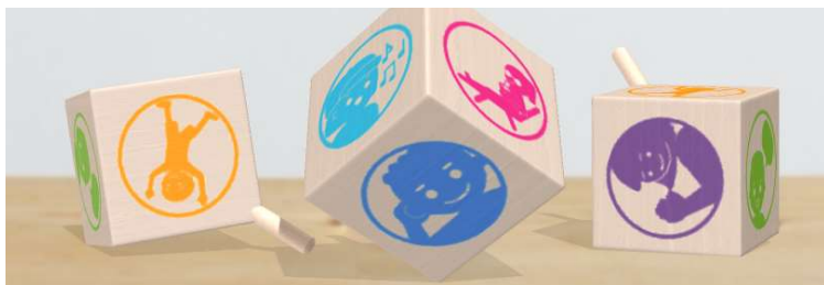
Idee und Grafik: EMA Evangelische Medienarbeit