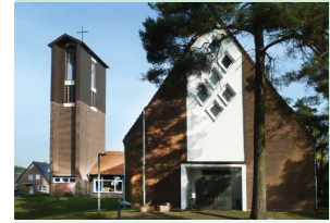
Trinitatis- kirche, Lingen Birkenallee 13

Sonntag, 18. Juni, 10.00 Uhr Gottesdienst – Prädikant Theilen