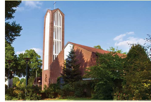
Johanneskirche Schützenstraße 11 Lingen