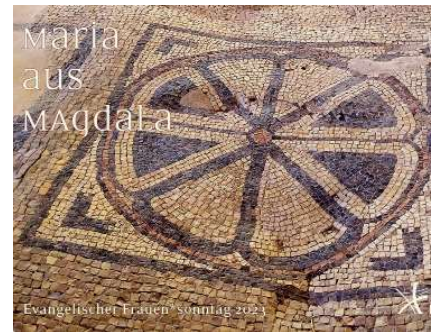
Titelbild der Arbeitshilfe

Maria Magdalena (richtiger: Maria aus Magdala), eine der bekanntesten biblischen Frauengestalten, steht im Mittelpunkt des evangelischen Frauen*sonntags 2023. Sie gehörte zu den Frauen, die Jesus schon in seiner Heimat Galiläa begegneten und sich seiner Bewegung anschlossen. Und sie blieb dabei – auch, als er am Kreuz hingerichtet wurde. Sie war dabei, als er begraben wurde und sie erlebte