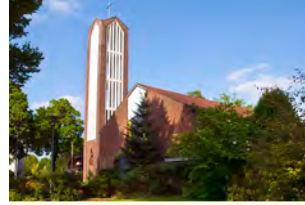
Johanneskirche Schützenstraße 11 Lingen