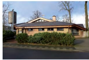
Kirchen- zentrum Lohne Friedensweg 3