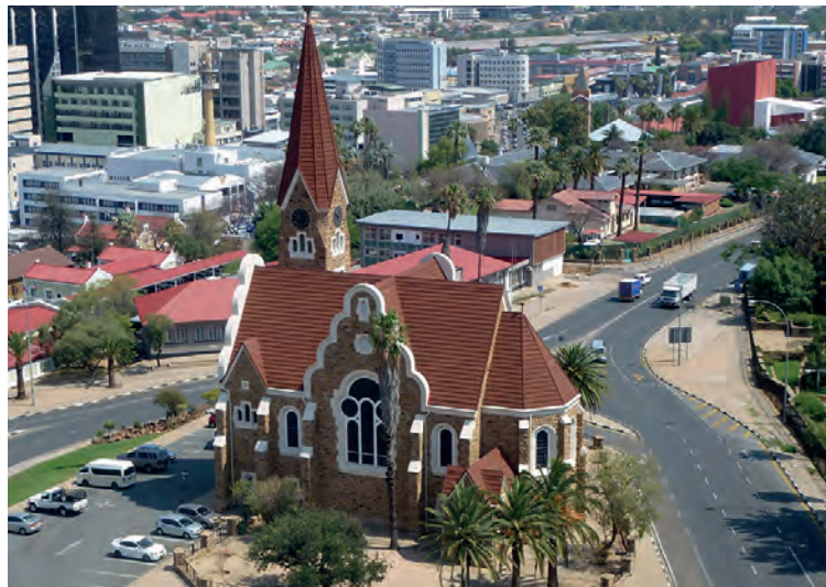
Christuskirche in Windhoek

Es wird um Anmeldung in den jeweiligen Pfarrbüros gebeten.