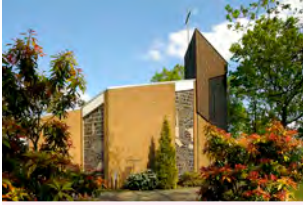
Christuskirche Sandbrinkerheidestraße 32 Brögbern

Sonntag, 19. Februar, 11.15 Uhr Gottesdienst in Biene mit dem gemeinsamen Chor der Christuskirche/Trinitatiskirche – Prädikantin Buck-Emden