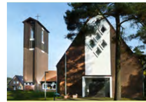
Trinitatis- kirche, Lingen Birkenallee 13

Bitte beachten: Bis zum 26. März finden die Gottesdienste im Gemeindehaus, Bäumerstr. 16, statt. Ab dem 02. April ist die Kreuzkirche wieder geöffnet.