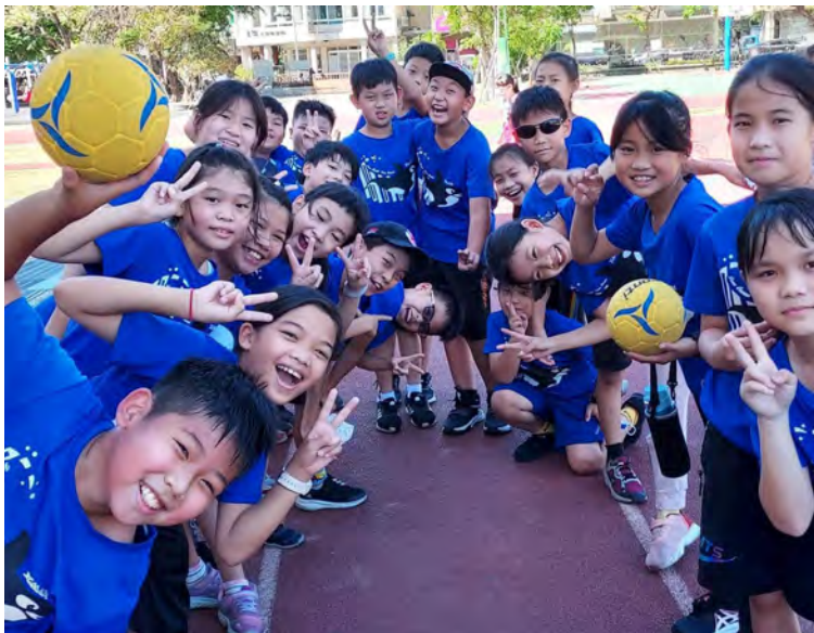
Kinder in Taiwan