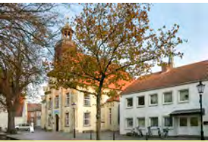
Kreuzkirche Universitäts- platz 1, Lingen