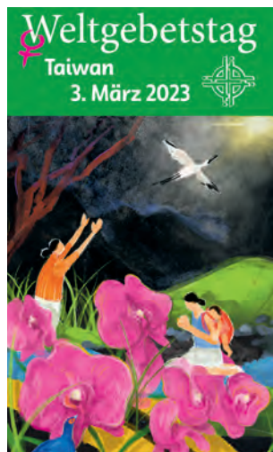
Das Titelbild stammt von der Künstlerin Hui-Wen Hsiao. Die Frauen auf dem Gemälde sitzen an einem Bach, beten still und blicken in die Dunkelheit. Trotz der Ungewissheit des Weges, der vor ihnen liegt, wissen sie, dass die Rettung durch Christus gekommen ist.