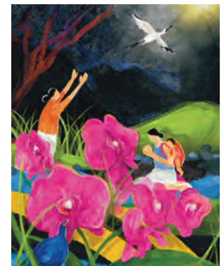
Titelbild zum Weltgebetstag 2023 aus Taiwan

Weitere Informationen zum Weltgebetstag im Teil Aktuelles.